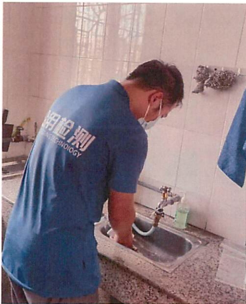
图 1：文边村党群服务中心采样口