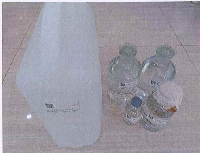
图 2: 鹤山北控水务四堡水厂出厂水样品