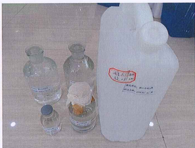
图 1: 鹤山北控水务四堡水厂出厂水样品