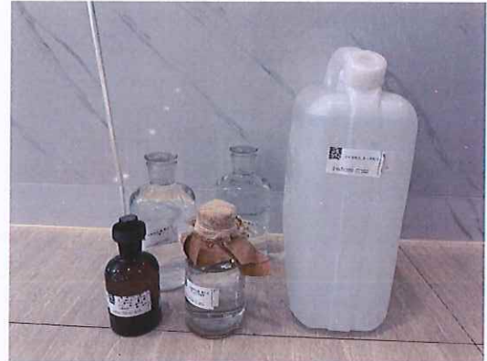
鹤山北控水务四堡水厂出厂水样品