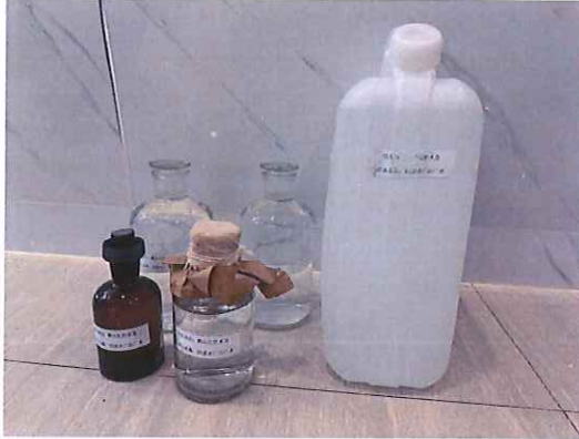
鹤山北控水务四堡水厂出厂水样品