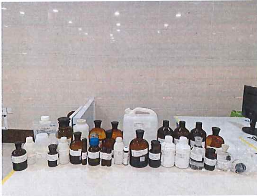
鹤山北控水务第二水厂出厂水样品